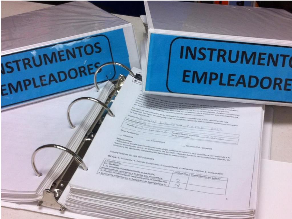
Fotos de las carpetas de instrumentos aplicados