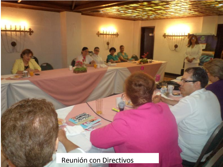
Reunión con Directivos