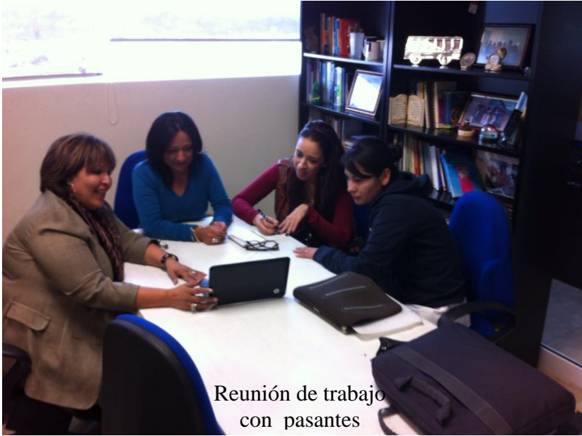
Reunión de trabajo con pasantes