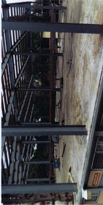
Facultad de Odontología, Campus I, Chihuahua, Chih.