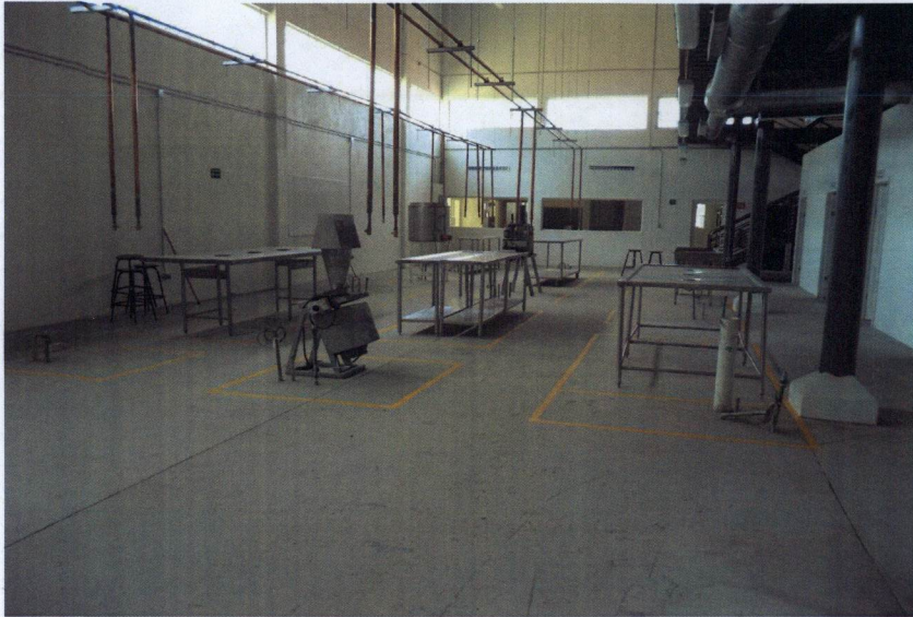
Equipamiento del Taller de Agroindustrias (Taller de Frutas y Hortalizas), de la Facultad de Ciencias Agrotecnológicas en Cd. Cuauhtémoc, Chih.