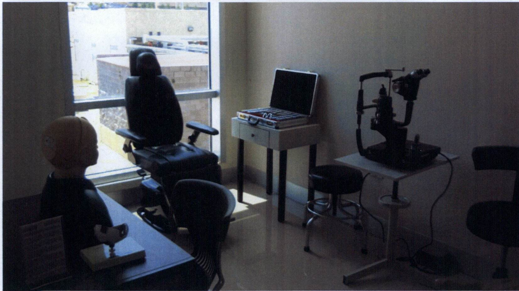
Equipamiento del Laboratorio de Simulación Avanzada de la Facultad de Medicina, Campus Chihuahua.