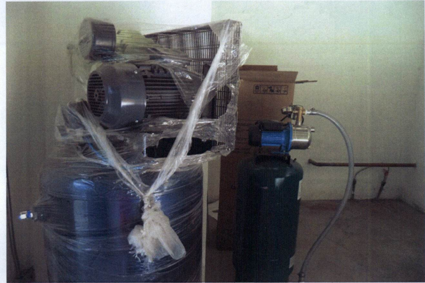
Equipamiento del Taller de Agroindustrias (Taller de Frutas y Hortalizas), de la Facultad de Ciencias Agrotecnológicas en Cd. Cuauhtémoc, Chih.