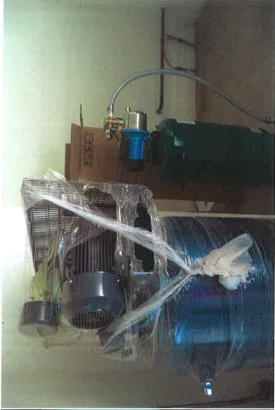
Equipamiento del Taller de Agroindustrias (Taller de Frutas y Hortalizas), de la Facultad de Ciencias Agrotecnológicas en Cd. Cuauhtémoc, Chih.