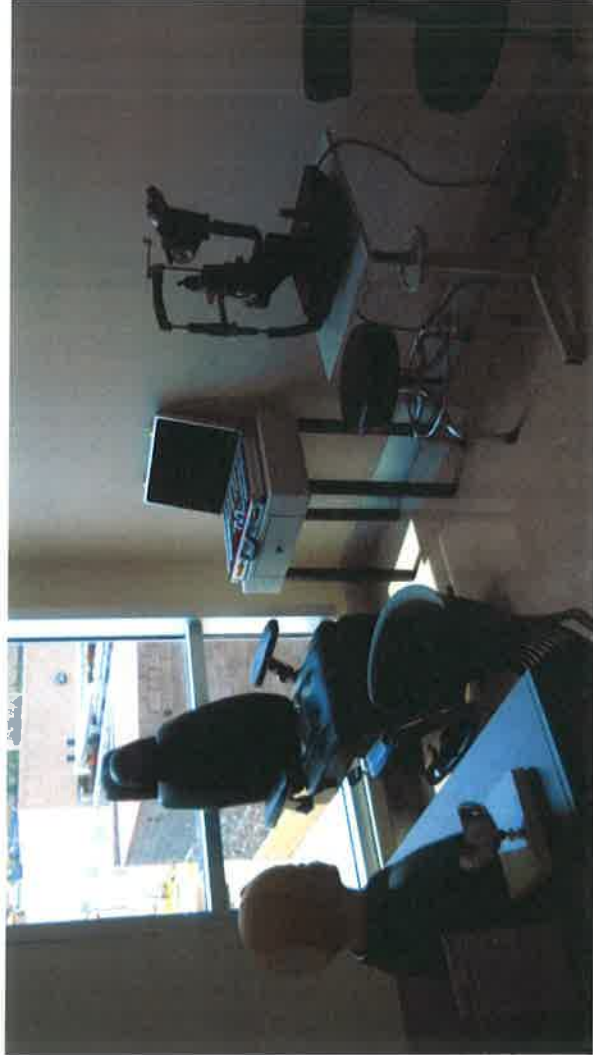
Equipamiento del Laboratorio de Simulación Avanzada de la Facultad de Medicina, Campus Chihuahua.