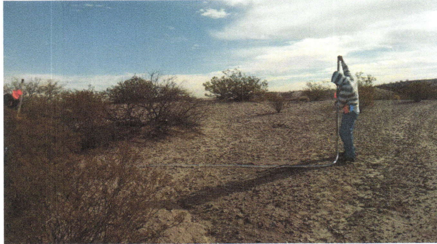
Imagen 1. Trazo de las curvas a nivel.