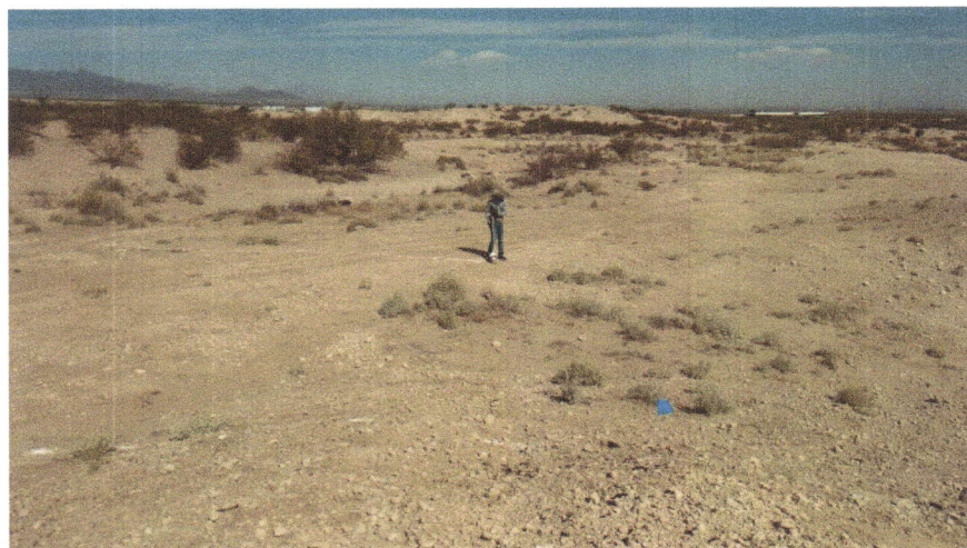
Imagen 4. Marcaje de la zanja trinchera con cal