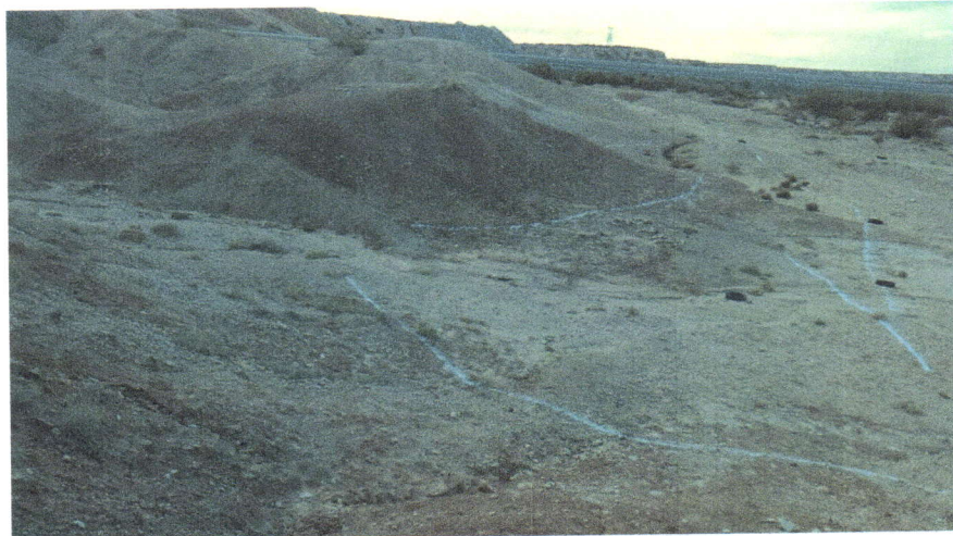
Imagen 5. Vista panorámica de las zanjas trincheras