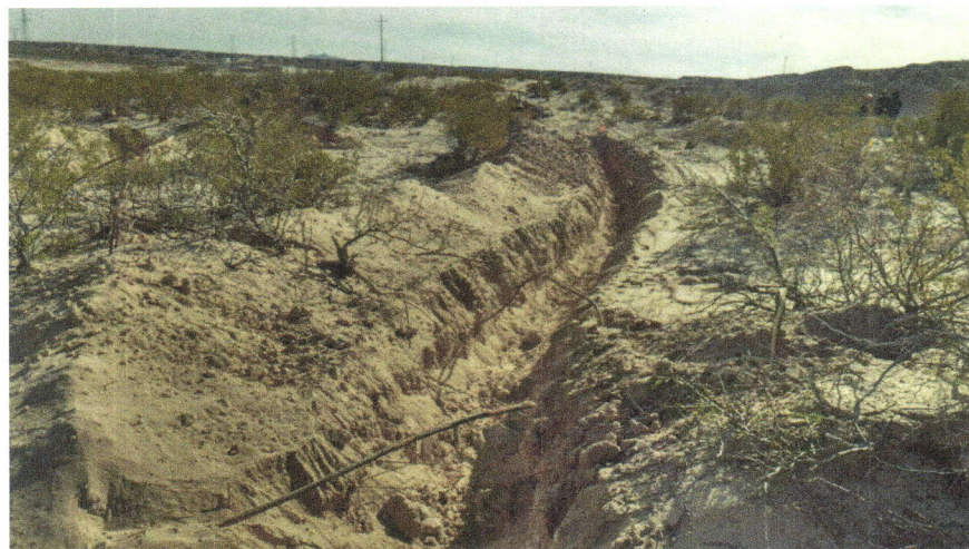
Imagen 10. Zanja trinchera concluida