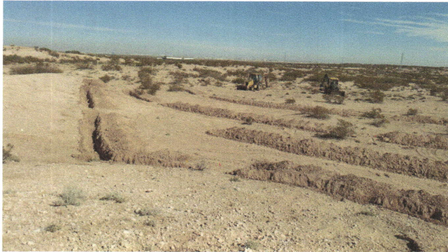
Imagen 7. Elaboración de zanja trinchera