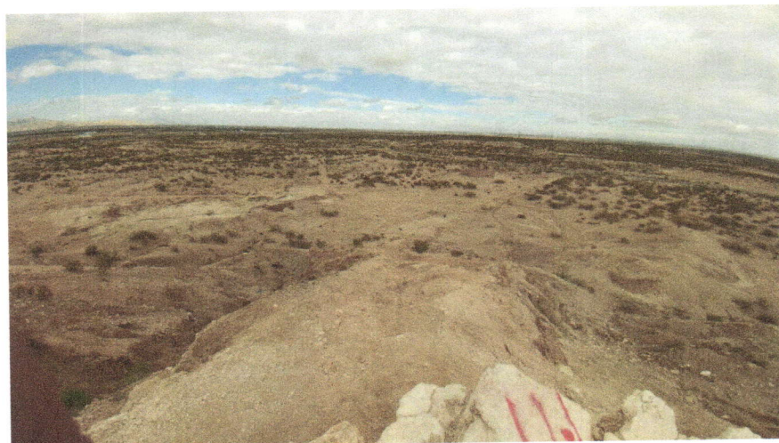
Imagen 6. Panorámica de las zanjas trincheras trazadas