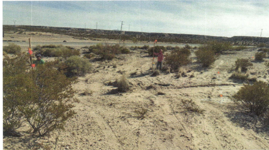
Imagen 2. Delimitación de las curvas a nivel.