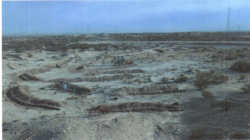
Imagen 11. Conformación de los bordos de las zanjas trinchera