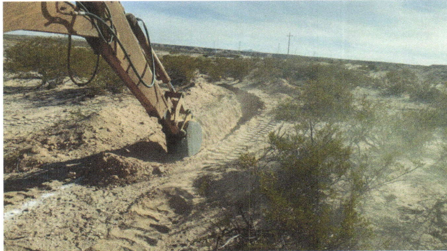
Imagen 9. Elaboración de zanja trinchera con maquinaria