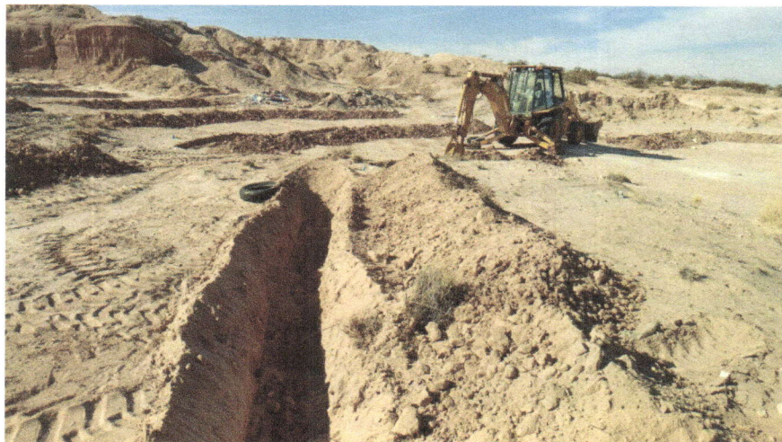
Imagen 8. Proceso de elaboración de zanjas trinchera con maquinaria