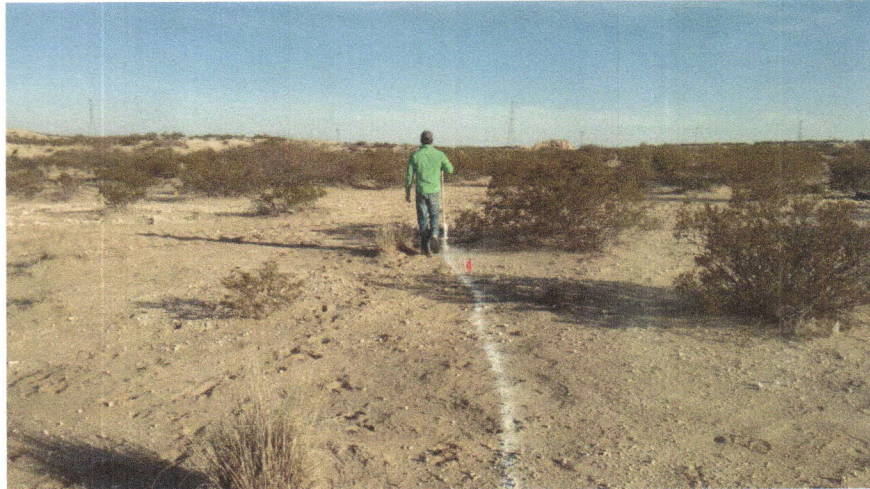
Imagen 3. Señalización de curvas a nivel