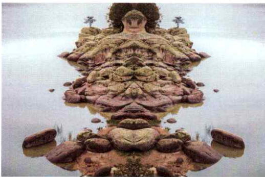
Versteinert Unkenntlich. - Es la "duplicación en espejo" de unas rocas en la orilla en la Laguna Juanota que forman una figura cuyo nombre traducido al español significa, sin figura ni forma.