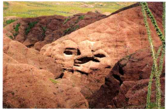
Picasso sobre la Roca. - Es una formación rocosa en Santa Ma. de Cuevas en la que la posición del sol, hace, que por medio de las sombras se forme un rostro muy parecido a los que pintaba Picasso.