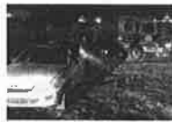
Hallan auto robado con cuerpo encajuelado y calcinado