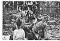
Texas deja morir a 3 mexicanos; leyes inhumanas