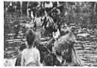
Texas deja morir a 3 mexicanos; leyes inhumanas