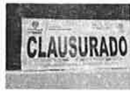
Supervisa Gobernación Estatal 276 establecimientos; clausura 4 en Chihuahua y 8 en Ciudad Juárez