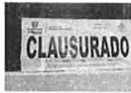
Supervisa Gobernación Estatal 276 establecimientos; clausura 4 en Chihuahua y 8 en Ciudad Juárez