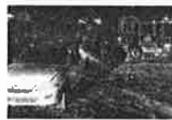
Hallan auto robado con cuerpo encajuelado y calcinado