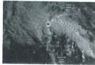
Tocó tierra tormenta Harold; avanzarán remanentes hasta Chihuahua