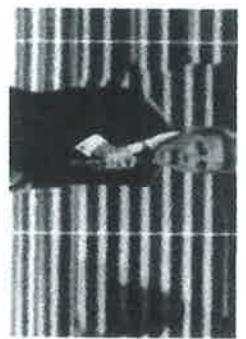
Hospitalizaron de emergencia a Luis Miguel en Chile