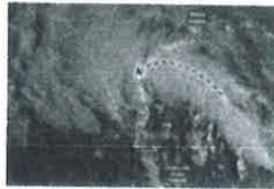
Tocó tierra tormenta Harold; avanzarían remanentes hasta Chihuahua