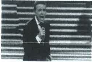
Hospitalizaron de emergencia a Luis Miguel en Chile