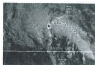
Tocó tierra tormenta Harold: avanzarán remanentes hasta Chihuahua