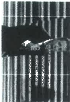
Hospitalizaron de emergencia a Luis Miguel en Chile