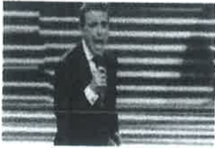
Hospitalizaron de emergencia a Luis Miguel en Chile