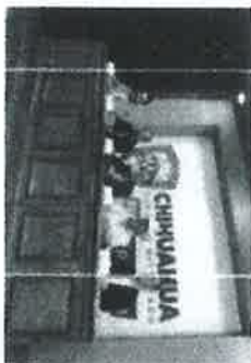
"Tenemos registro de 46% de agua en presas": Alcantar Ortega