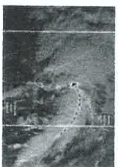
Tocó tierra tormentosa Herold, avanzarán remanentes hasta Chihuahua