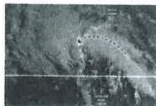
Tocó tierra tormenta Harold; avanzarán remanentes hasta Chihuahua