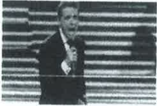
Hospitalizaron de emergencia a Luis Miguel en Chile