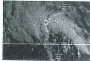
Tocó tierra tormenta Harold, avanzarán remanentes hasta Chihuahua