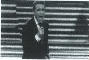
Hospitalizaron de emergencia a Luis Miguel en Chile