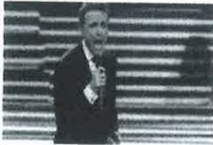
Hospitalizaron de emergencia a Luis Miguel en Chile