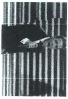
Hospitalizaron de emergencia a Luis Miguel en Chile