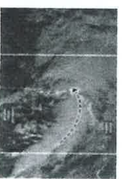
Torcó tierra tormenta Harold: avanzarán remanentes hasta Chihuahua