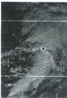
Tocó tierra tormentada Haroldo: avanzarán remanentes hasta Chihuahua