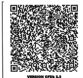
VERSION CFDI 3.3

REGIMEN FISCAL: 601 - General de Ley Personas Morales LUGAR DE EXPEDICION: 44110 FORMA DE PAGO: 01 - Efectivo METODO DE PAGO: PUE - Pago en una sola exhibición MONEDA: MXN - Peso Mexicano USO DE CFDI: G03 - Gastos en general