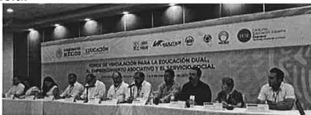
Autoridades en la inauguración