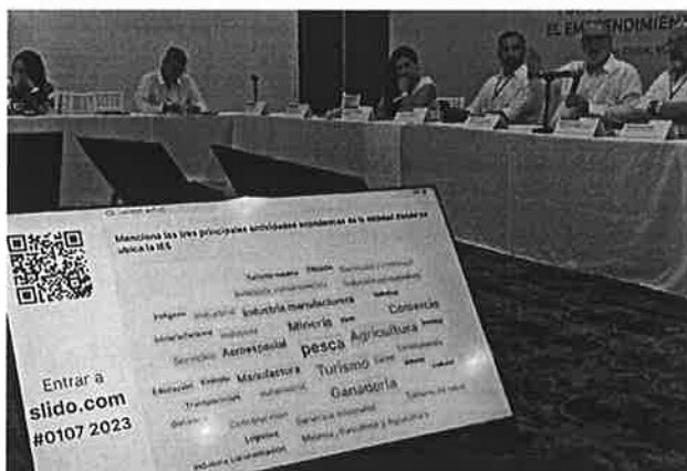
Ejemplo del sondeo