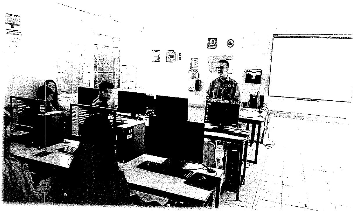
VISITA FACIATEC CUAUHEMOC. 26 ABRIL 2023