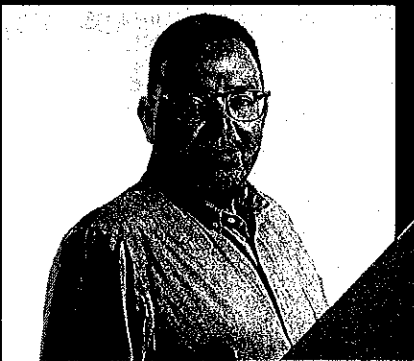
HUGO BARAJAS MARTÍNEZ CANDIDATO A PRESIDENTE MUNICIPAL DE MUNICIPIO DE AEDAMA PARTIDO ACCION NACIONAL