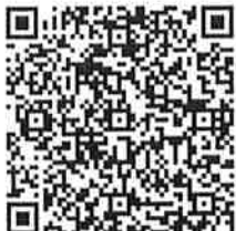
Cadena original del complemento de certificación digital del SAT

bbiRNWBbumDTW8u+BUQcT1Z1euO24d038gwIzTwYPcePsJn5xl5+MsG6IKX8DEZ7HnfulXC+Z9Xpw1lSyFskDCJoc/ISCXV0/eOD5x+noN7zLIBd5QV5JkEG1kxZHb1Qsta8E0ODLdYQjR8TpiVpOpDPqDjB taTPJ+EuS4c7NHfi6B9/rDyRZH7OzrKrOvkddmQYeaO5VoRfR9ePNqj5UlywleDagw4+hqmrNcQCFmlnIPrNPaS57c3gOHstiZ5MUvH2h5s3V5cnUJoC1rEa9JYA6XmJ1S2nPrDv6zRV8ACzIVahu3h9Yw lff0520VGe+Wkh5o3eFBjy71ug==